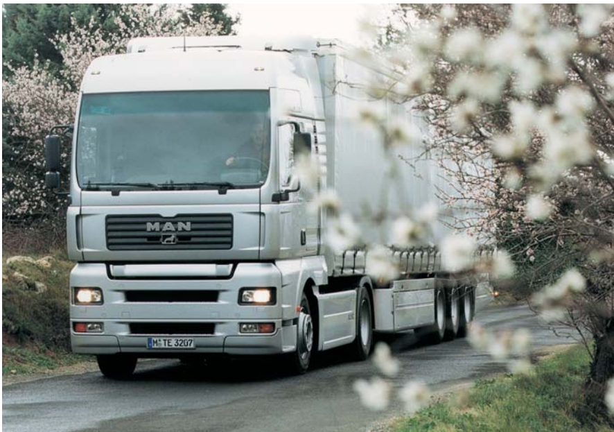
Weltweit auf allen Straßen zu Hause: Die Nutzfahrzeuge von MAN

Für Michael Kobriger hat die schnelle Entwicklung der SCMo-Lösung den Vorteil, dass sich Effekte äußerst zeitnah einstellen können. Zudem bedeuten kürzere Entwicklungszeiten allgemein entsprechend geringere Lösungskosten. Den besonderen Charme von SCMo unter .NET sieht Kobriger aber hier: „Für unsere Lieferpartner ist der Einstieg in das Supply Chain Monitoring äußerst günstig. Sie benötigen lediglich einen internetfähigen PC und einen Webbrowser.“ Dieser Kostenaspekt spielt die entscheidende Rolle, wenn es um die Durchsetzung der Lösung entlang der kompletten Supply Chain geht. Derzeit sind etwa 20 direkte Zulieferer integriert, zügig werden die anderen folgen.